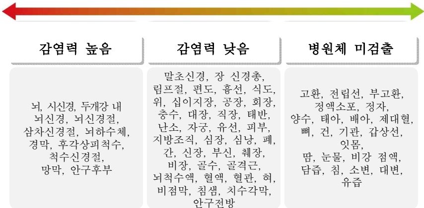
그림 1 | 인체 조직 부위별 감염력 비교

※ 감염력이 없는 검체(타액, 외분비물, 대·소변 등)에 대한 특별관리 불필요